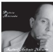
Portada original y contra-portada / Original cover and back photos: Craig Damon ( http://craigdamon.com )